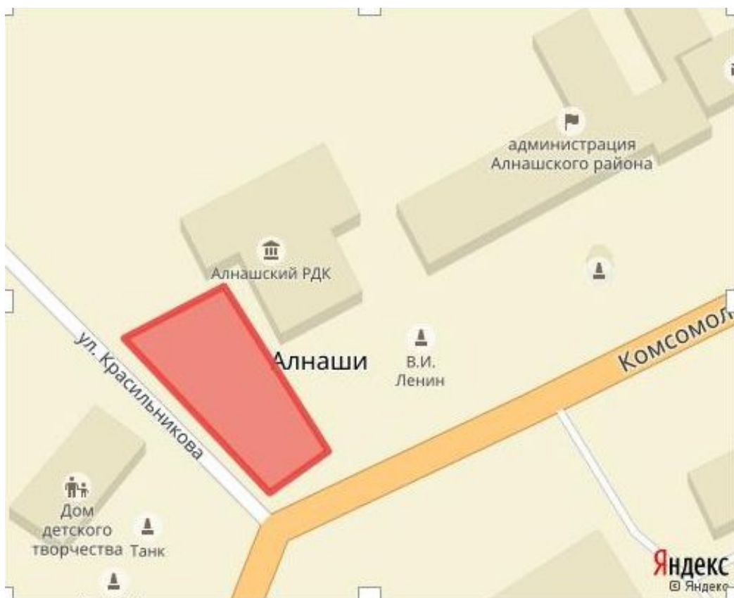
Место для нового мемориального комплекса